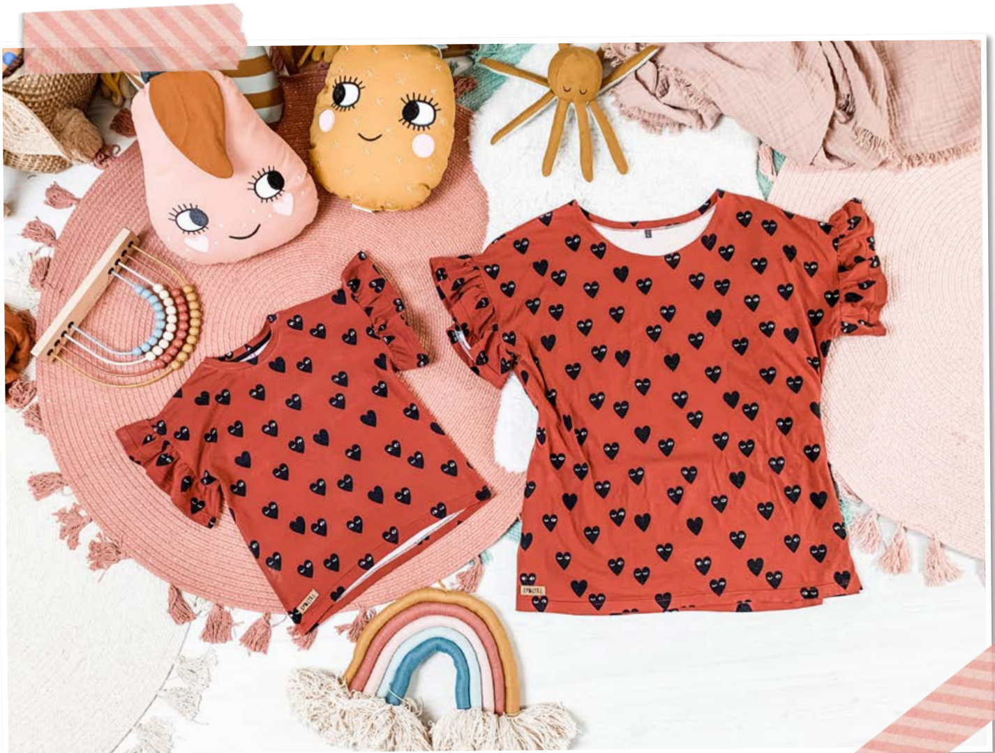
FERTIG! Links einmal das Kids-Shirt mit Halsbündchen und rechts ein Shirt für die Mama mit Beleg!