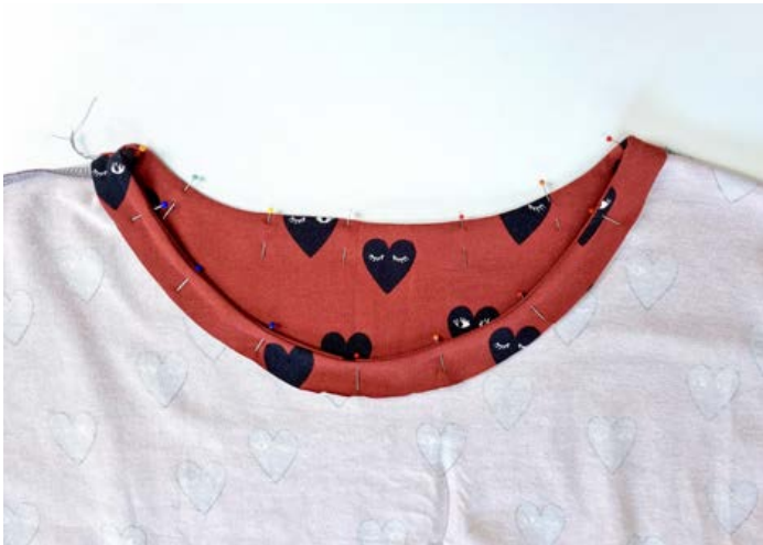
19. Den Beleg nach innen umklappen und feststecken.