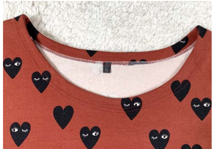
20. Manche nähen den Beleg gerne knappkantig am Ausschnitt fest. Hier wurde er mit ca. 2 cm Abstand zum Ausschnitt, mit einer Coverlock, festgenäht.